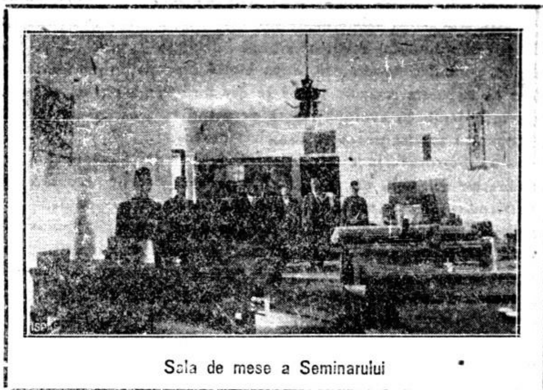
Sala de mese a Seminarului