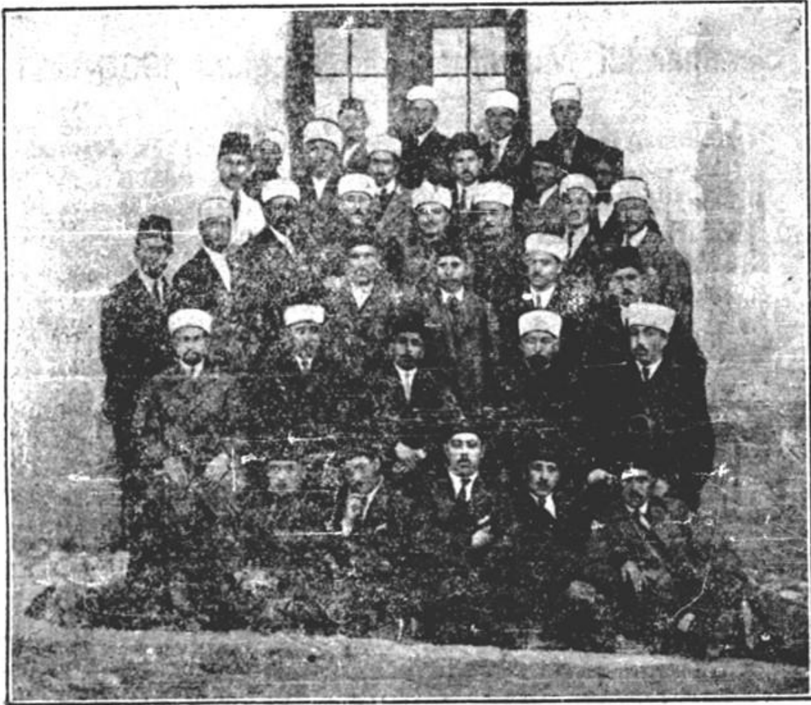
Un grup de absolvenți ai Seminarului